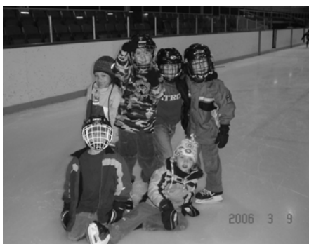
Patinage à l'aréna de Sainte-Croix

Nous vous attendons en grand nombre pour la semaine de relâche 2007