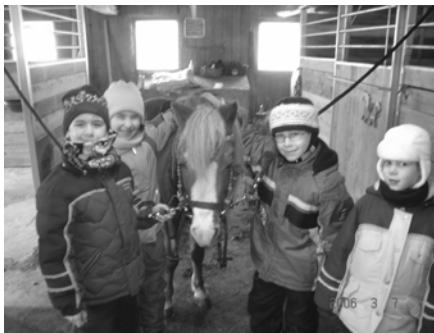
Activités aux Cabrioles de Tilly