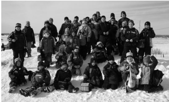
Glissades de Lotbinière

Du 6 au 10 mars avaient lieu les activités offertes par le Centre communautaire dans le cadre de la semaine de relâche