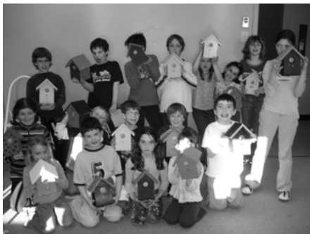
Construction de cabanes d'oiseaux

En moyenne, 27 jeunes par jour ont participé aux diverses activités