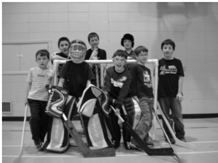
Sports dans le gymnase